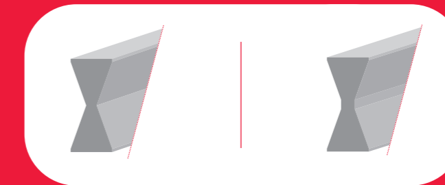
POUTRE DE CHARPENTE OU DE PLANCHER