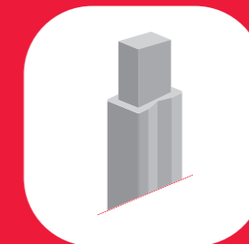
POTEAU SUPPORT DE POUTRE DE CHARPENTE