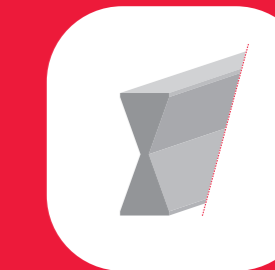
PANNE DE CHARPENTE