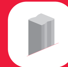
POTEAU SUPPORT DE POUTRE DE PLANCHER