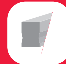
POUTRE RECTANGULAIRE SUPPORT DE PLANCHER